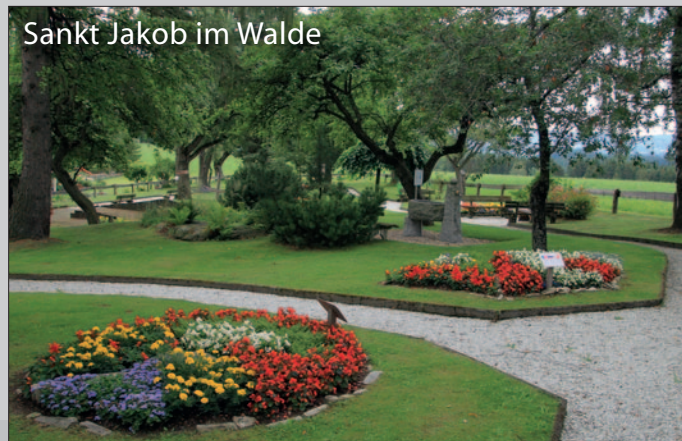
Sankt Jakob im Walde