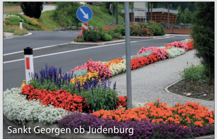
Sankt Georgen ob Judenburg