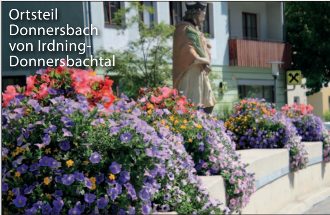
Ortsteil Donnersbach von Irnding- Donnersbachtal