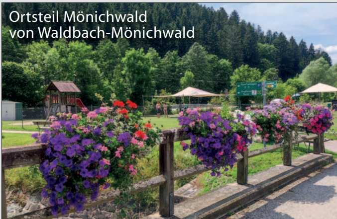
Ortsteil Mönichwald von Waldbach-Mönichwald