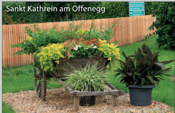
Sankt Kathrein am Offenegg