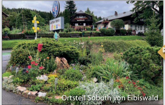
Ortsteil Soboth von Eibiswald