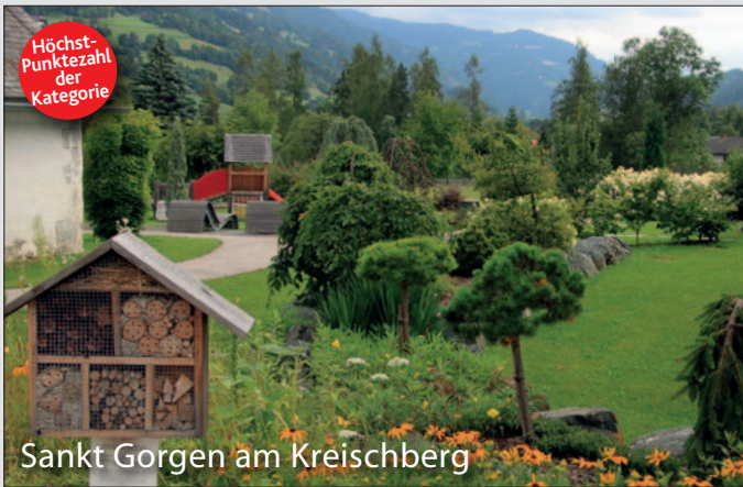
Sankt Gorgen am Kreischberg

Alle Informationen zum heurigen Bewerb: www.blumenland.at