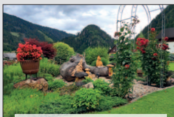
Sonderpreis Garten: Frau Silvia Birnbaum für Gartenanlage mit Schnitzkunst, Wildalpen