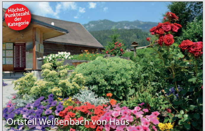
Ortsteil Weißenbach von Haus