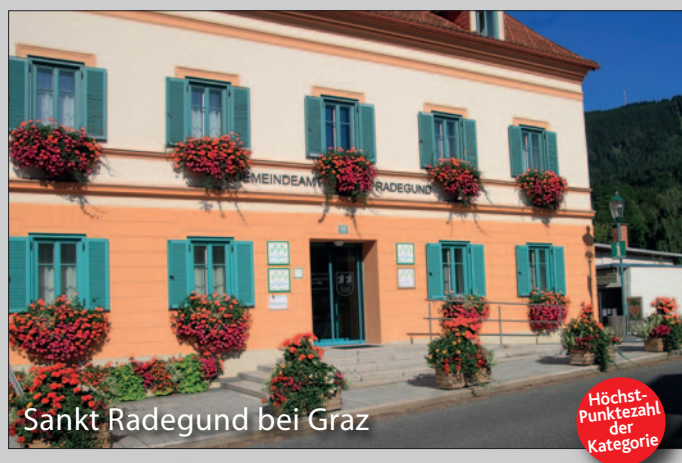
Sankt Rade Gund bei Graz